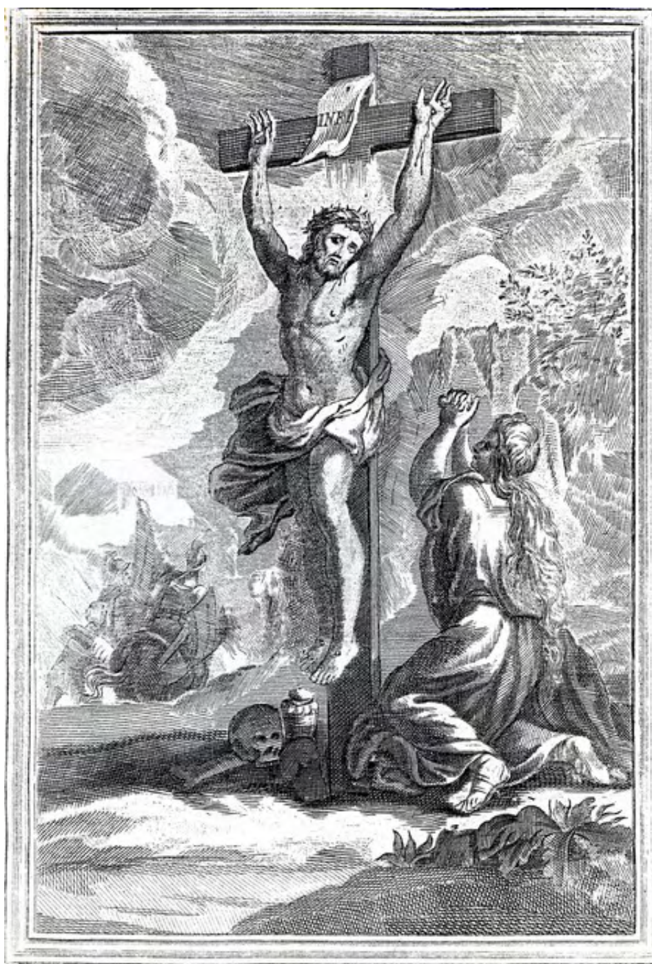
Missale Romanum , Maceratae, MDCCCXXVII Crocefissione, incisione su lastra di rame. (Collezione Antonio Di Vincenzo - Penne)