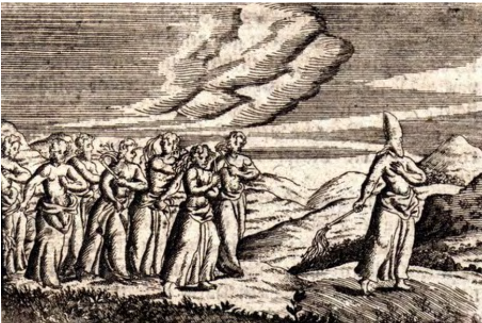
Papa Clemente IV con i flagellanti, xilografia, fine XVII secolo. (Collezione Antonio Di Vincenzo - Penne)